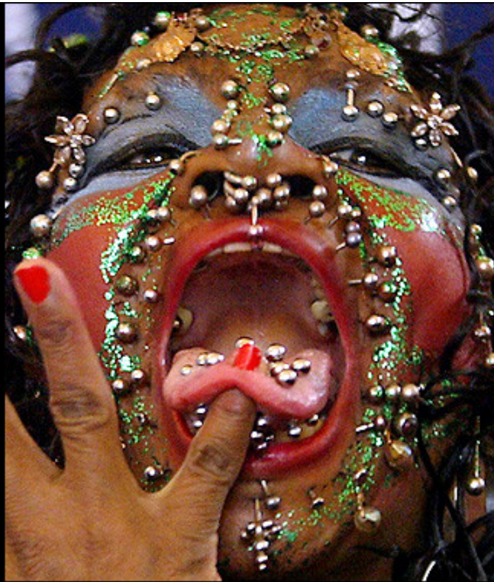
Record mondial de piercings (2520).

Toute forme de scarification, de tatouage, de piercing est formellement condamnée par les Ecritures. Lorsque j'ai reçu de la part d'un internaute ce fichier extrait d'un site eschatologique Américain ( http://www.cuttingedge.org ) et que j'ai médité sur la condition de cette jeune fille, au-delà de mon impuissance à accepter une telle chose, j'ai ressenti l'un des plus grands désespoirs de ma vie.