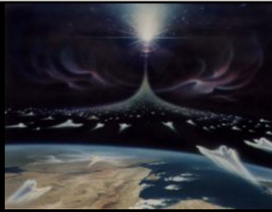
illustration extraite du site " http://www.pleinsfeux.com "