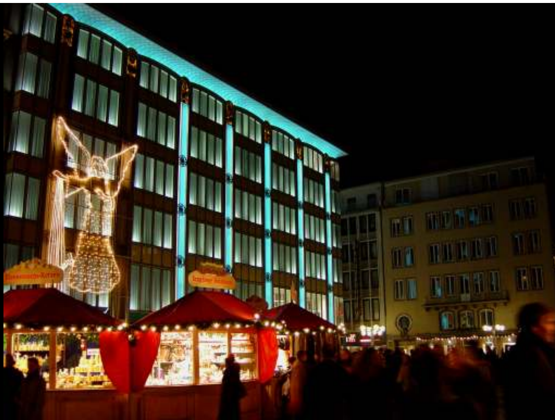
Marché de Noël sur le parvis de la cathédrale à Cologne

Document personnel - pas de copyright - Décembre 2003