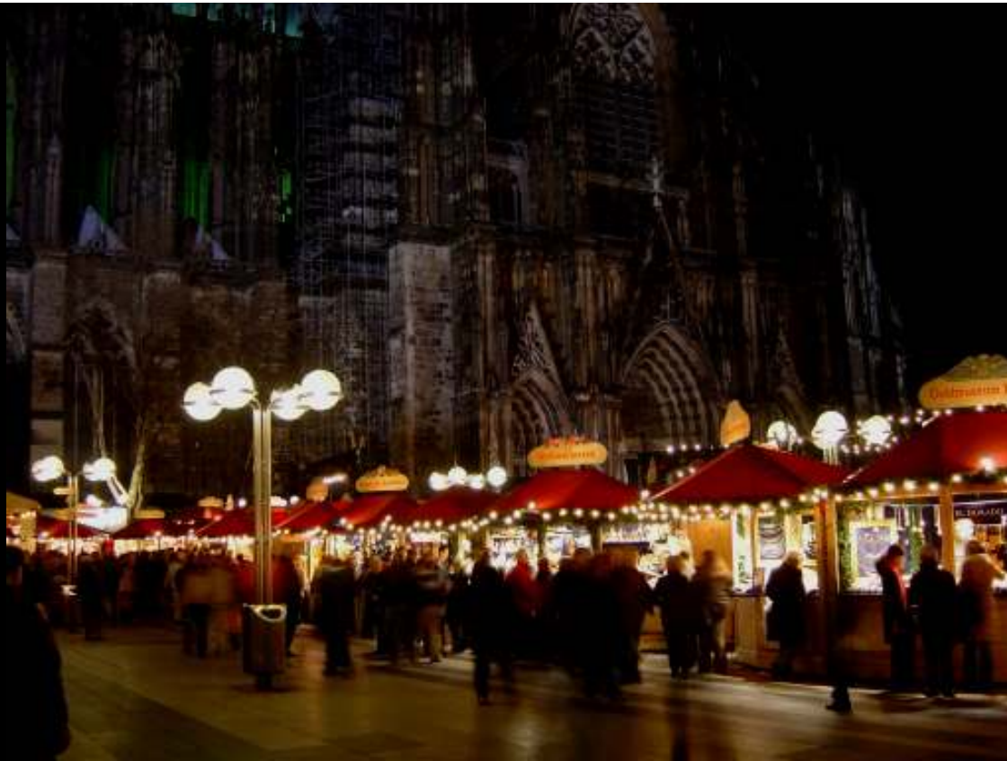
Marché de Noël sur le parvis de la cathédrale à Cologne

Document personnel - pas de copyright - Décembre 2003