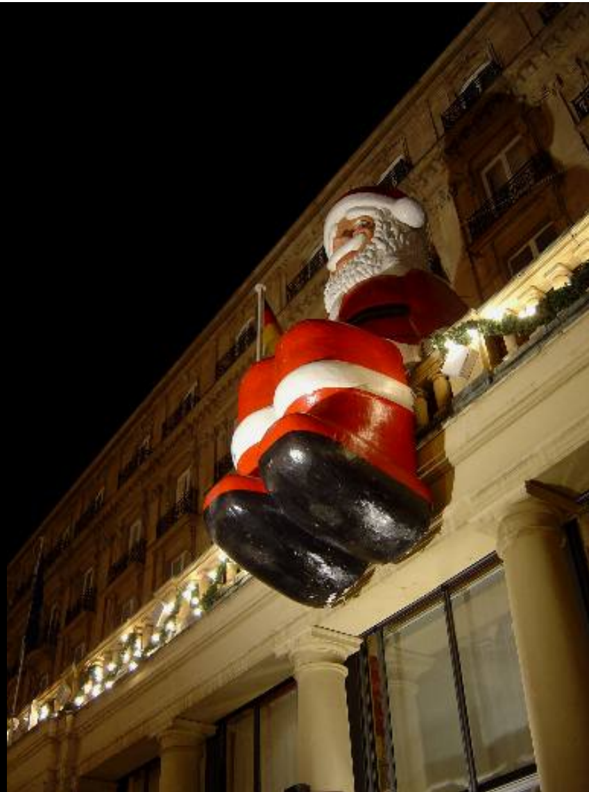
Effigie de Père Noël Géant assis en surplomb au-dessus du marché de Noël sur le parvis de la cathédrale à Cologne

Décembre 2004