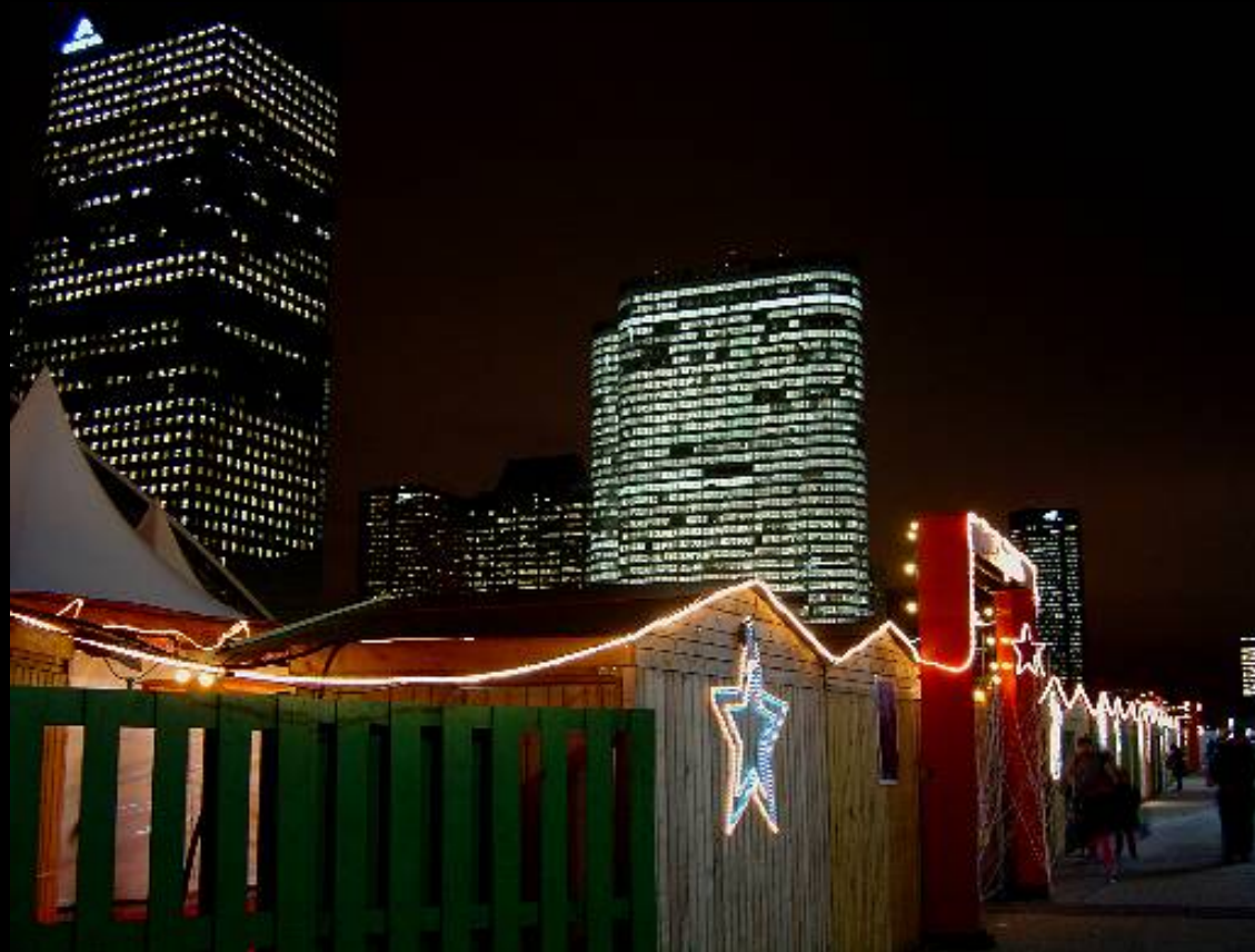
"Marché de Noël"

Esplanade de l'Arche de La Défense à Paris