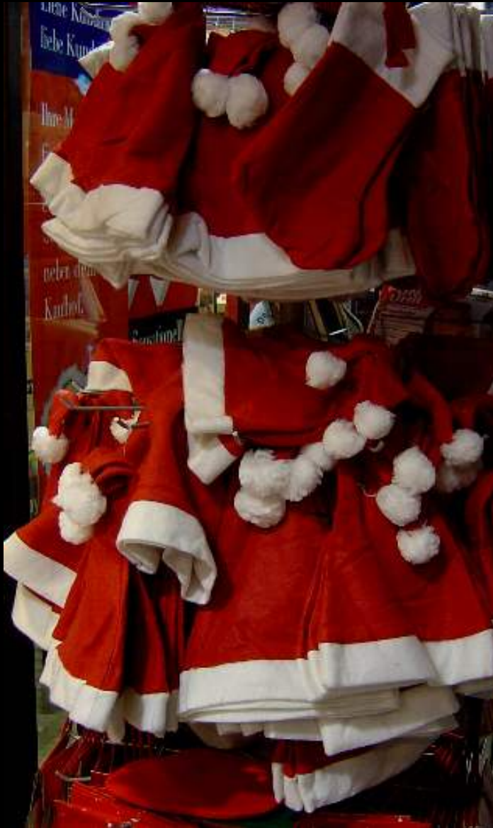
Bonnets et accessoires de "Père Noël"