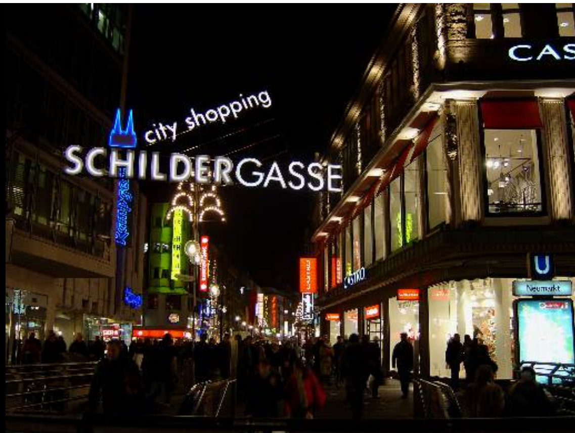
Rue commerçante en centre ville de Cologne

Document personnel - pas de copyright - Décembre 2004