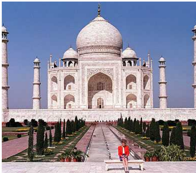
Diana photographiée, solitaire, devant le tombeau du Taj Mahal

reniait et le musée-mausolée fut ouvert en 1998, du 1 er juillet, date anniversaire de la naissance de sa sœur au 31 Août, date anniversaire de sa mort. Cette période Juillet-Août nous rappelle que si Diana s'était mariée un 29 juillet 81, c'est un 28 août en 96 que le divorce avait été officialisé. L'argument de reverser 10% à la fondation Diana, c'est à dire une dîme , ne peut masquer l'aspect mercantile de la démarche empressée de cet opportuniste manquant singulièrement d'inspiration . Ces dates qui semblaient dues au hasard révèlent à leur manière une stratégie qui semble scellée et obéir à des arcanes profondément occultes.