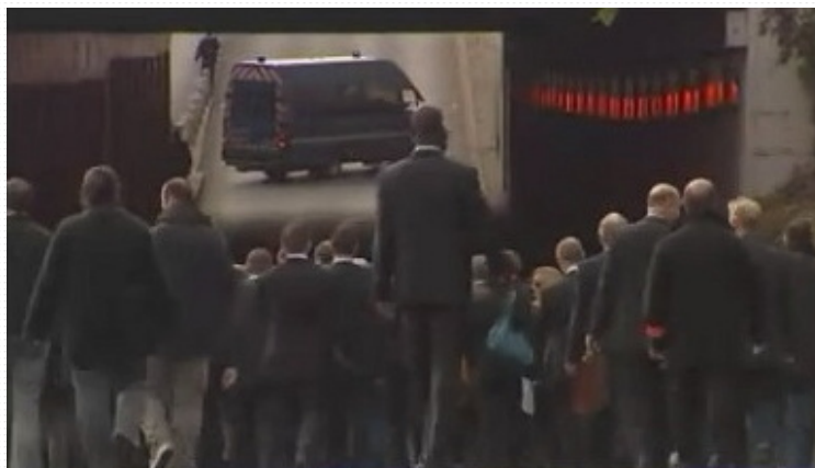
Visite du jury dans le tunnel à Paris

http://english.pravda.ru/photo/report/diana-2627/4/