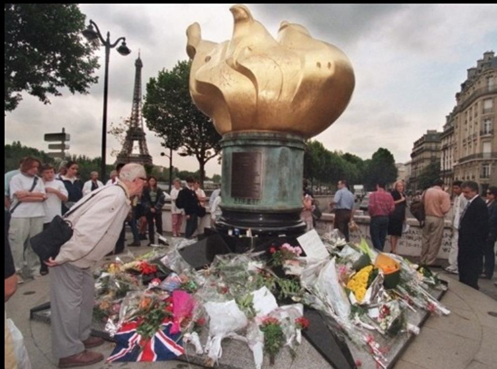
Comme de jour!