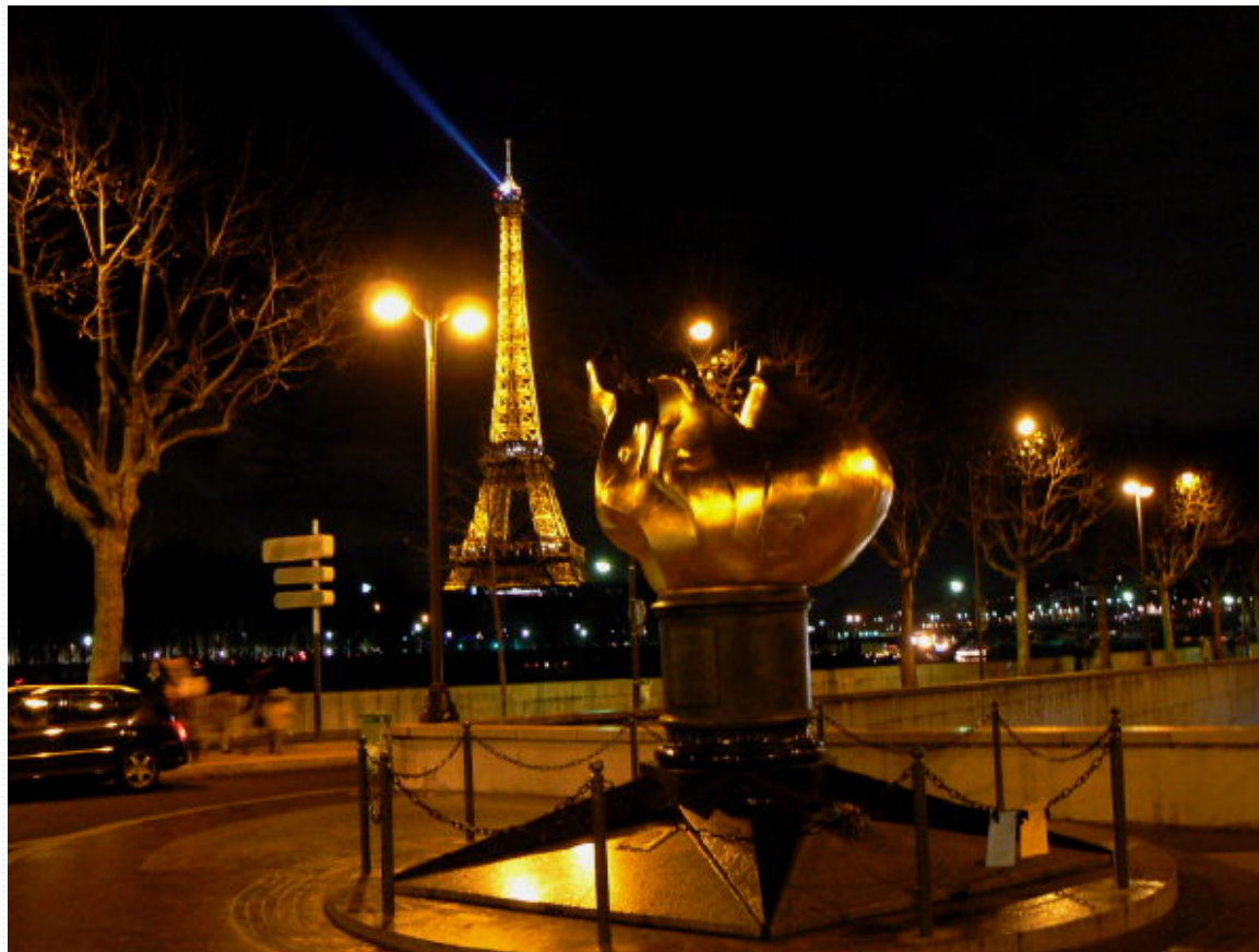
Pont et tunnel de l'Alma

- Flamme commémorative de la Révolution de 1789 - Paris -