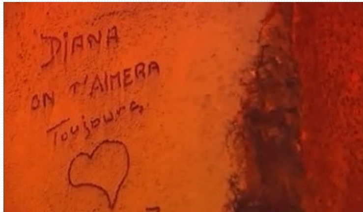
Graffiti sur le 13 e pilier du tunnel