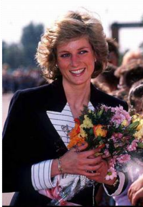
Lady Diana Spencer