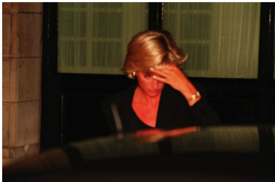
Diana quittant le Ritz avant de monter dans la limousine