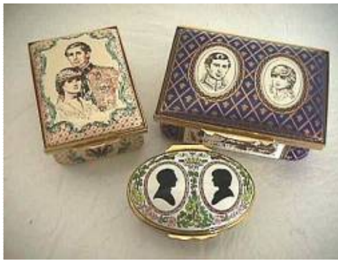
Objets commémoratifs du mariage du Prince Charles et de Diana Spencer le 29.7.81