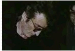
John Lennon signant un autographe devant son meurtrier

plein milieu d'une année qui pouvait être lue dans les deux sens après renversement.