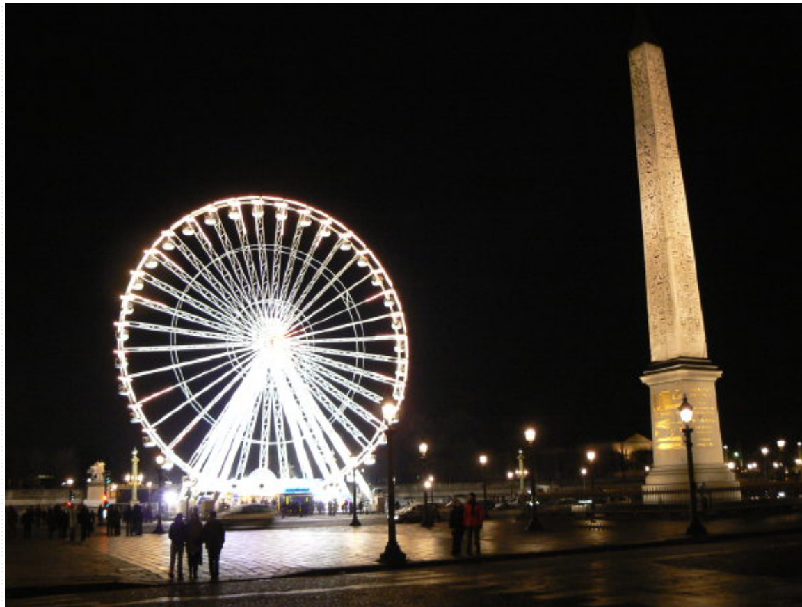
- Obélisque de la place de la Concorde - Paris -

- Document personnel - pas de copyright - Décembre 2005 -