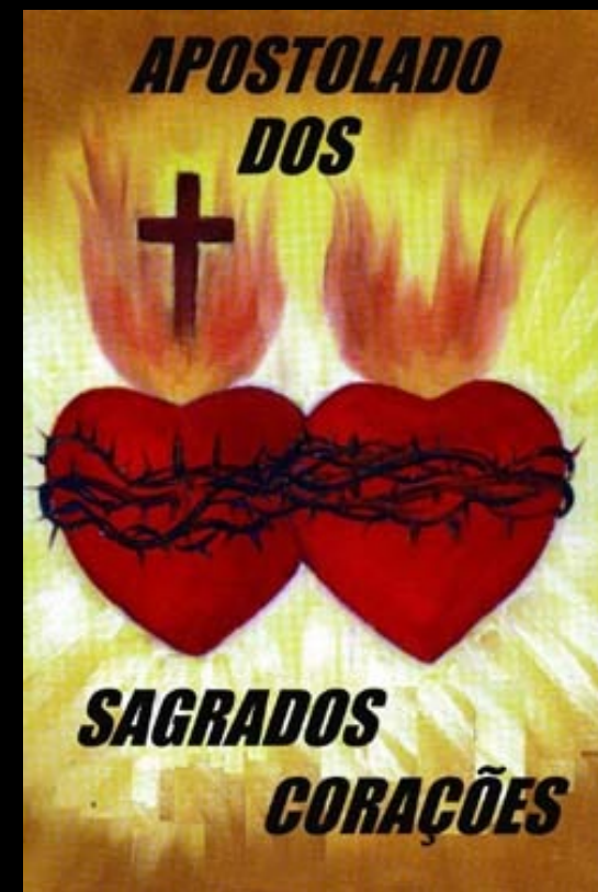
"Cœurs sacrés" de Jésus et Marie

Sources: http://www.lekiosquereligieux.com/m2s3.html