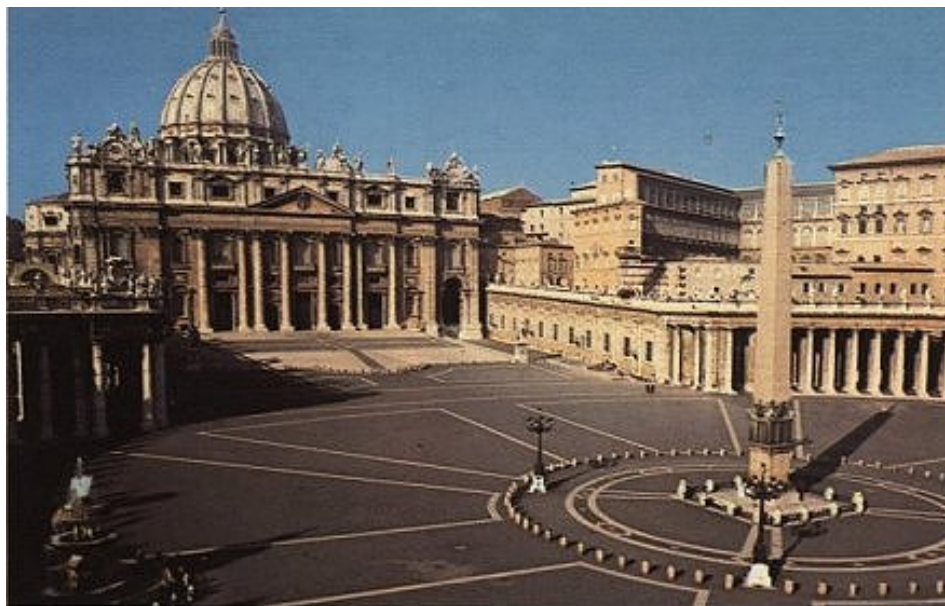
Obélisque de Baal sur la Place St Pierre (Vatican)

voir le lien: http://www.ovni007.com/id122.html