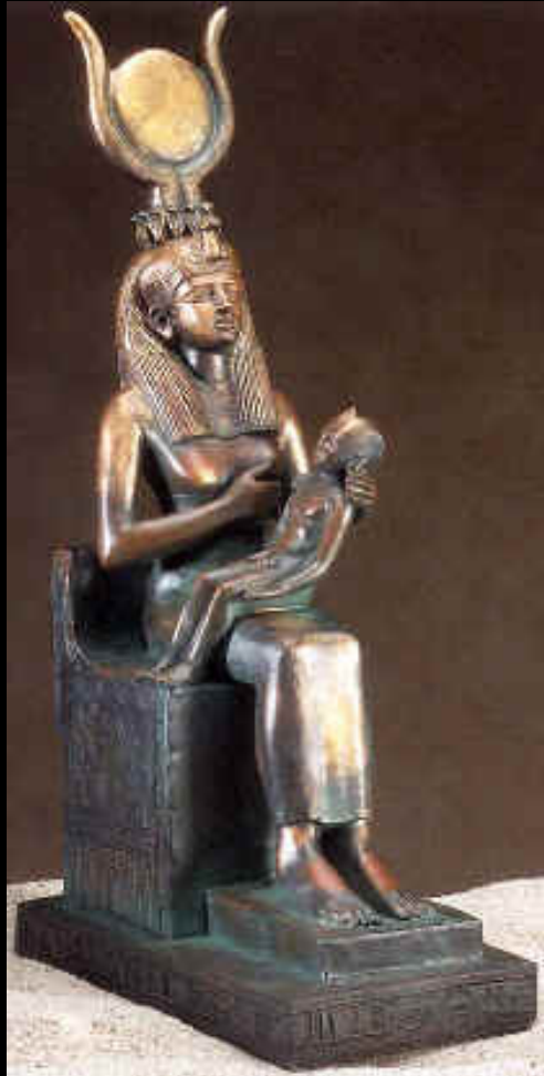
Isis et son fils Horus

ISIS et son fils Horus se rattachent à la Sémiramis Babylonienne, épouse de Nemrod, une figure de l'Antechrist.