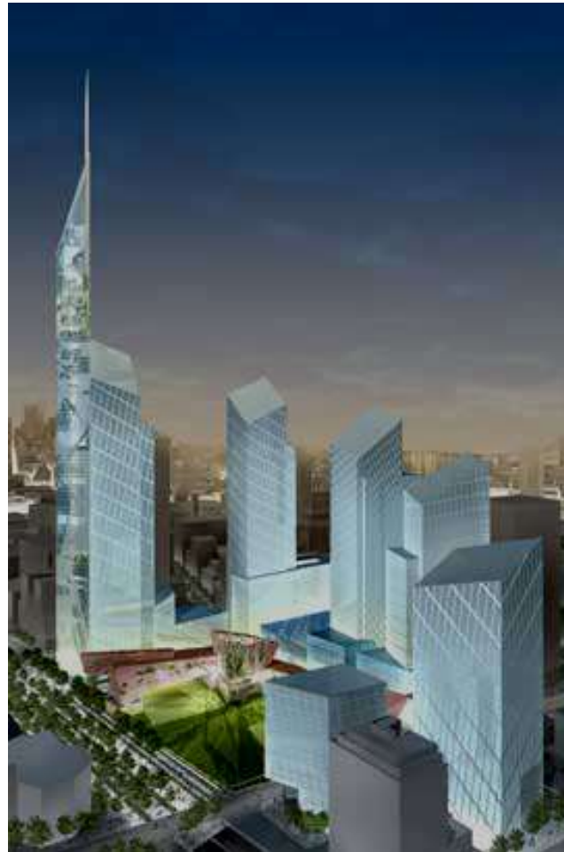
Maquette du nouveau World Trade Center