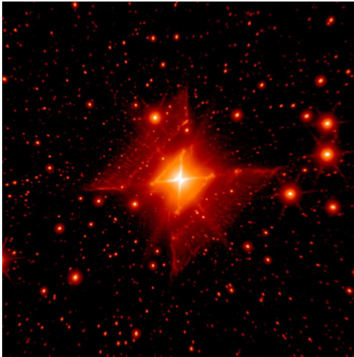
Nébuleuse MWC 922

Nébuleuse " Red Square " Captée par les télescopes Palomar et Keck