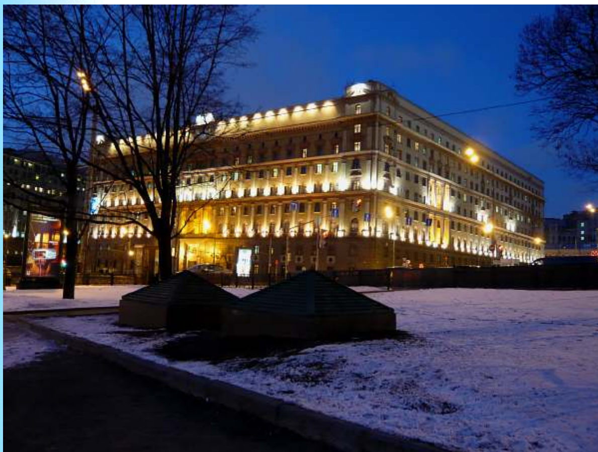
– Bâtiment du KGB – Février 2008 – Moscou –