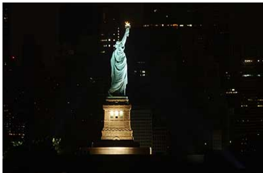
Statue de la Liberté à New York