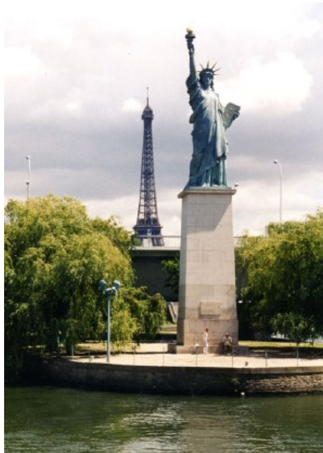
Statue de la Liberté sur la Seine à Paris

Photo crédit: Adrian Pingstone (Juin 2002)