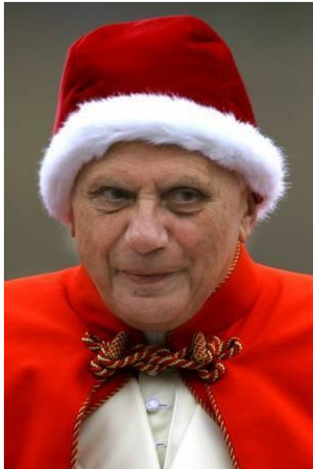
Pape Benoît XVI..