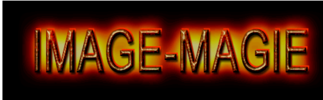
IMAGE - MAGIE

En attendant que les lieux soient libres de toute présence humaine pour pouvoir prendre un cliché d'une partie de la crèche, et en regardant la mer battre le bord de plage, une des séquences animées projetées en boucle, sur l'un des écrans de décor, j'avais ressenti un malaise profond en me remémorant ce verset particulier tiré de l'Apocalypse Johannique.