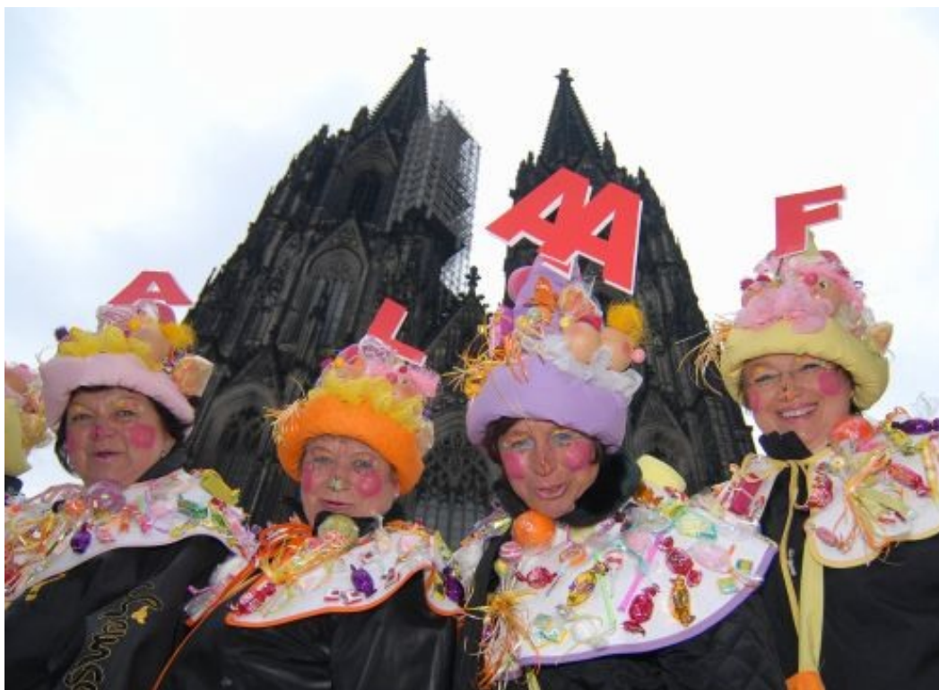
Carnaval de Cologne Carte électronique

Je reprends un extrait du texte dédié au Carnaval de Cologne sur le lien: http://www.koeln.de/tourismus/karneval/fr-2000ans.html